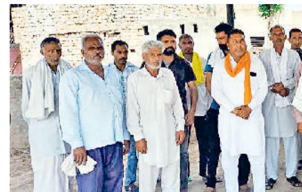
फतेहाबाद। गांव भिरडाना में कचरा शैड बनाने का विरोध करते ग्रामीण।