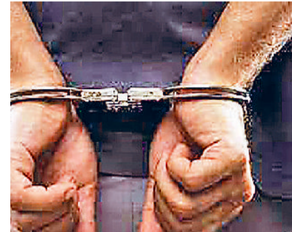
भद्रकला में उसके खिलाफ एनडीपीएस एक्ट के तहत मामला दर्ज किया है।