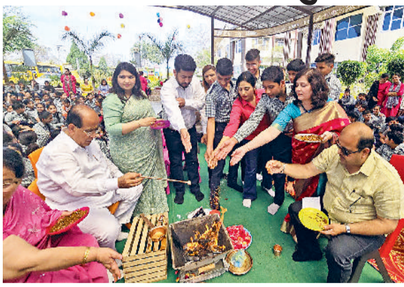
फतेहाबाद। पॉयनियर स्कूल में नए शैक्षणिक सत्र के शुभारंभ पर हवन में भाग लेते स्कूल प्रबंधक।