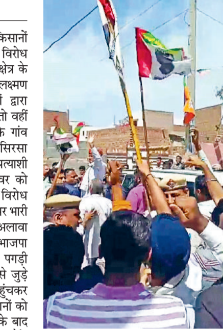
फतेहाबाद। गांव करनौली में भाजपा प्रत्याशी अशोक तंवर की गाड़ी को घेरकर नारेबाजी करते किसान।