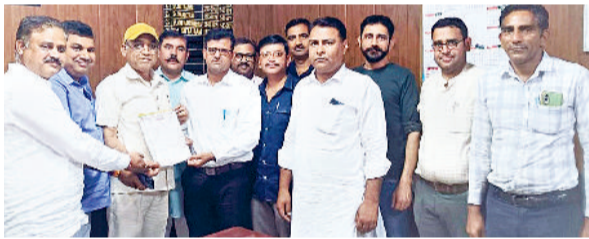
सिरसा। डीईईओ को मांग पत्र सौंपते अध्यापक संघ के प्रतिनिधि।